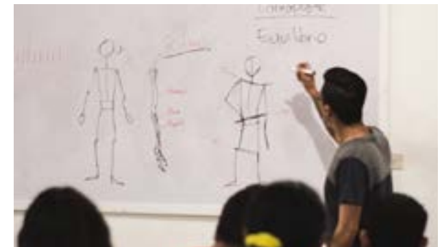
Jiménez compartió de la proporción de la figura humana