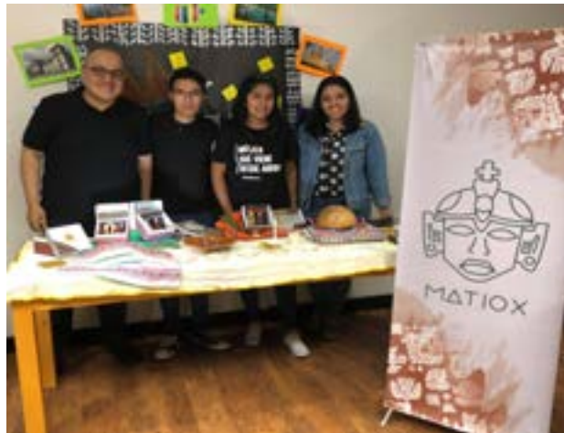
Grupo No. 6, marca publicitaria: Matiox