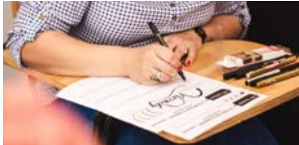
Ejercicios básicos para lettering