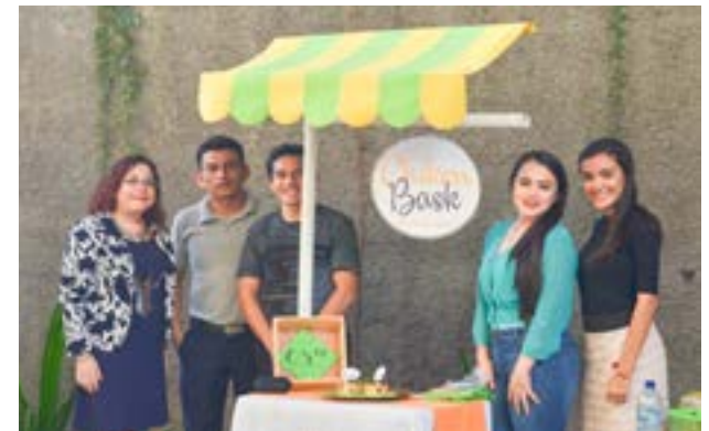
Grupo No. 4, producto: canasta de pan con relleno de pollo