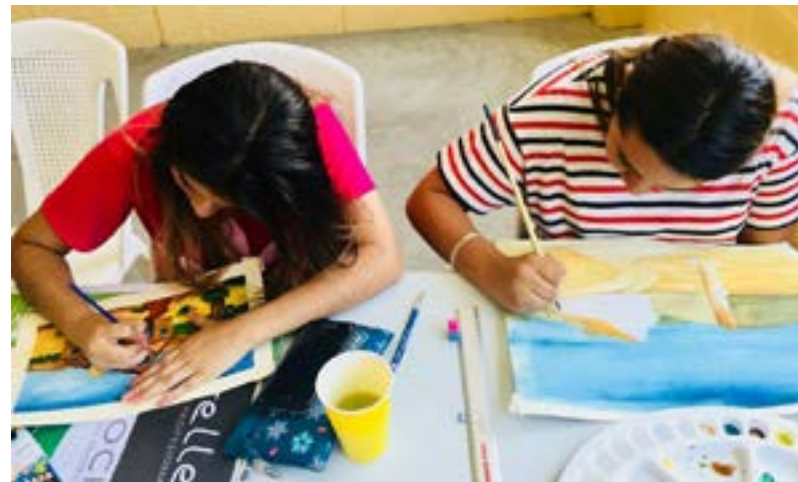
Foto No.5 Taller de Acuarela