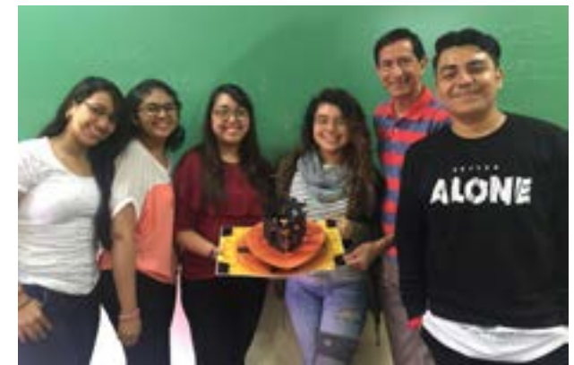
Maqueta No. 6: Tonos cálidos y color negro