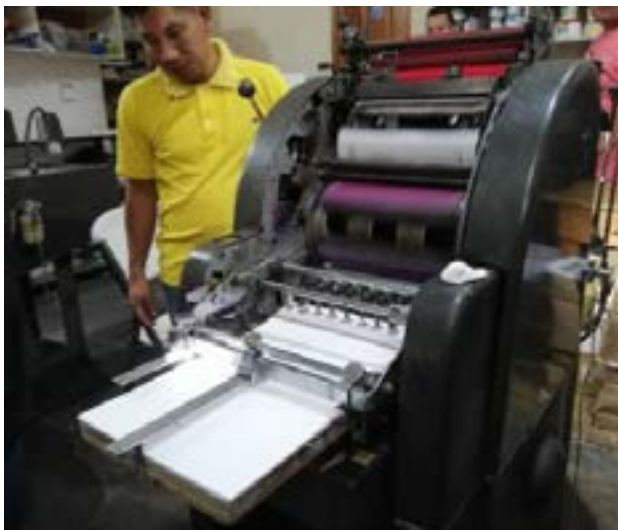
Visita a la imprenta Graficentro, los estudiantes conocieron las diferentes máquinas para impresión

También visitaron los estudios de Amigos TV.