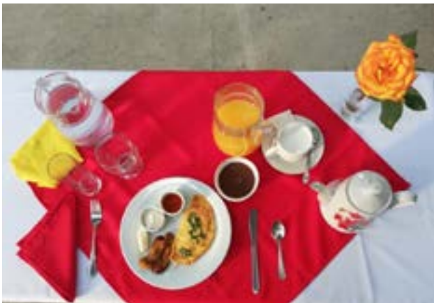
Comida: Omelette, salchicha, jugo de naranja y café