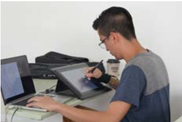
Jiménez realiza una ilustración digital