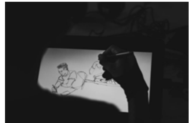
Proceso de elaboración de un dibujo digital