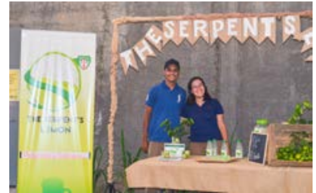
Grupo No. 7: limonada con sal