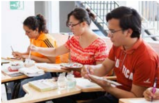
Estudiantes hacen mezclas para aplicar la técnica de acuarela