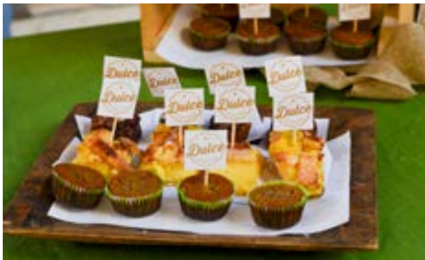
Presentación de cubiletes de chocolate y pastel de elote