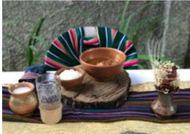
Comida: Pepián y arroz blanco