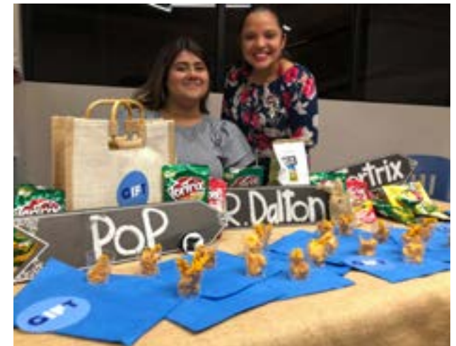
Grupo No. 7, marca publicitaria: Gift