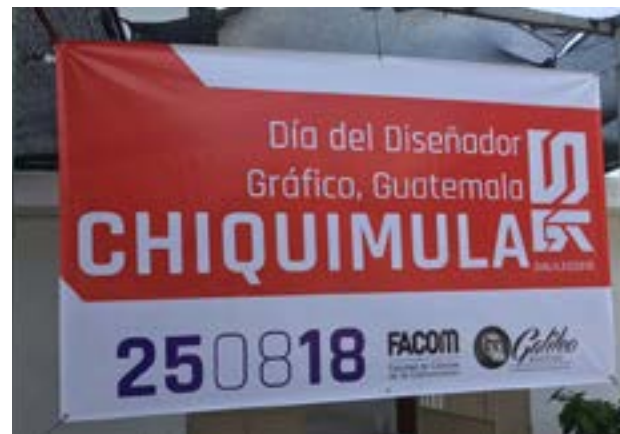
Banner del Día del DG en Chiquimula