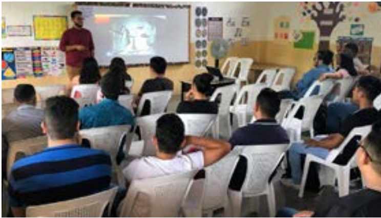
Participantes taller de fotografía