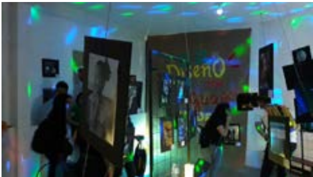
Toma general de la exposición de fotos