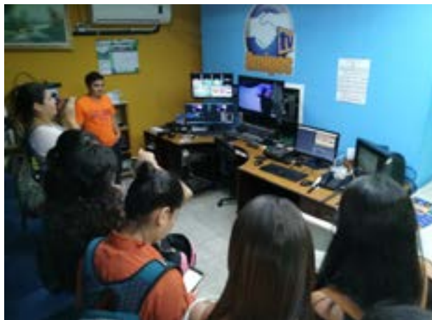
Estudiantes conocen el equipo de transmisión en línea del canal de TV