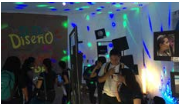
Estudiantes observan las fotos expuestas

También los estudiantes realizaron una exposición de fotografía, los ganadores del montaje del Primer lugar fueron los estudiantes de 5to. Año, y los del Segundo Lugar los estudiantes de Segundo Año de la Licenciatura en Comunicación y Diseño.