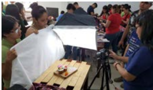
Grupo No. 2: montaje de cupcakes