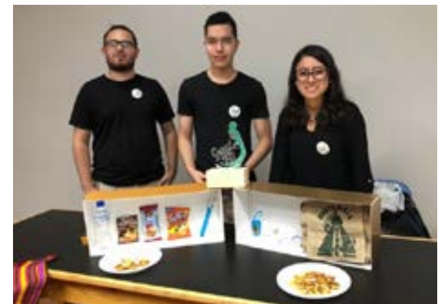
Grupo No. 4, marca publicitaria: Quetzal