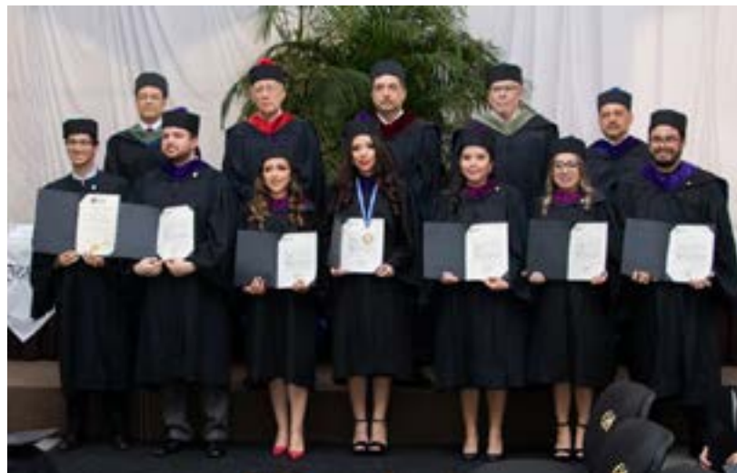
Grupo No. 2 de graduandos