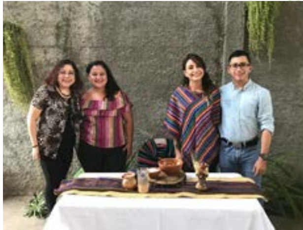
Grupo No. 5, Montaje: almuerzo típico