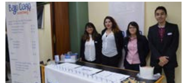
Grupo No. 4, empresa: Bajo Cero