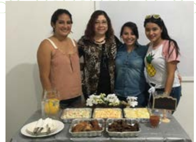
Grupo No. 6, Montaje: almuerzo tipo buffet