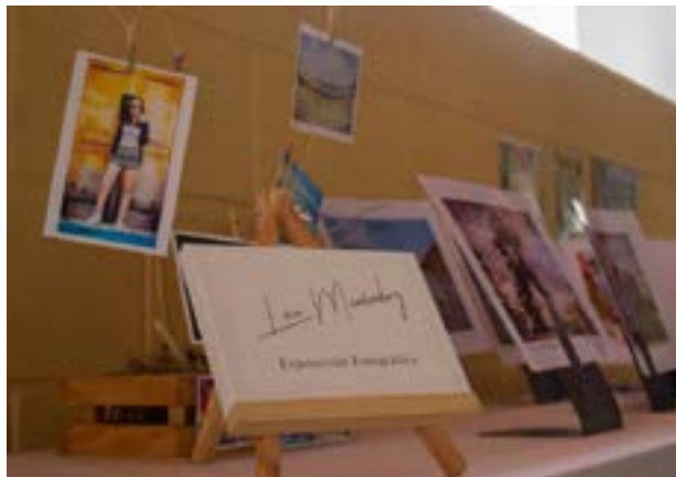
Detalle de la muestra de fotografías