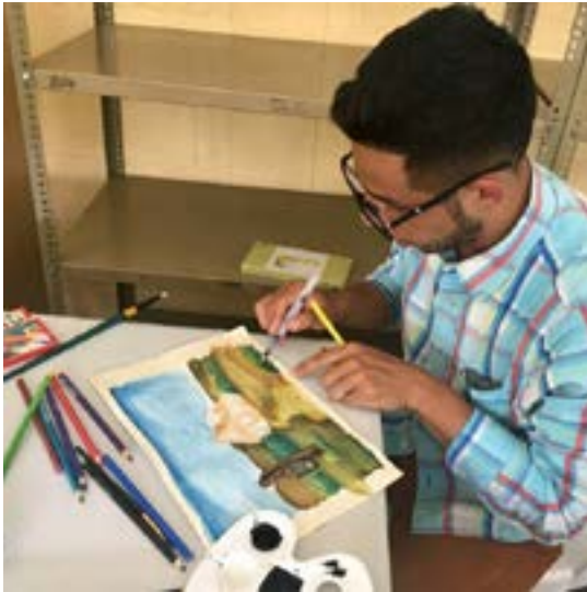
Foto No.1 Taller de Acuarela