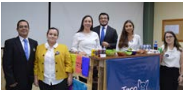
Grupo No. 2, empresa: Taco