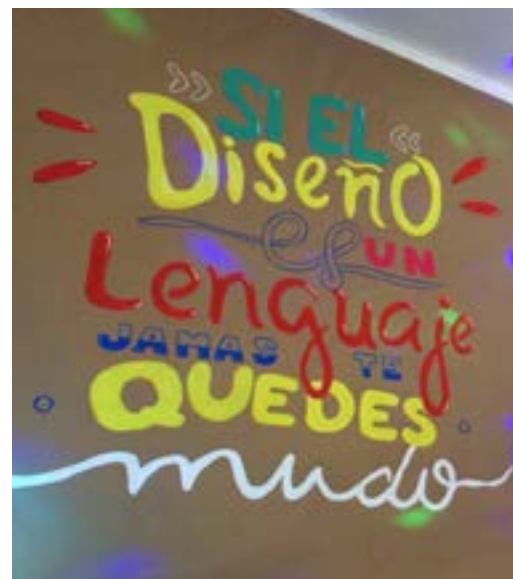
Detalle de la exposición, rótulo con tipografía de colores