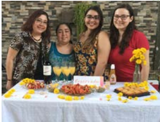
Grupo No. 2, Montaje: cocktail de día