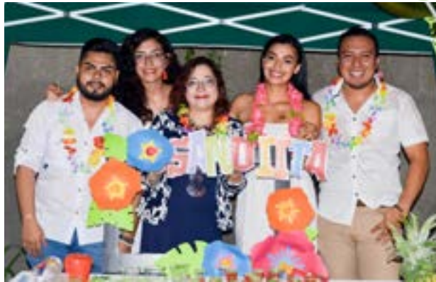
Grupo No. 1, producto: bebida tropical de sandía

La finalidad principal era realizar diferentes actividades para llamar la atención de los consumidores y dejarles una experiencia al adquirir los diferentes productos presentados, dentro de los que se pueden mencionar, café, quesadilla, limonada salada, entre otros.