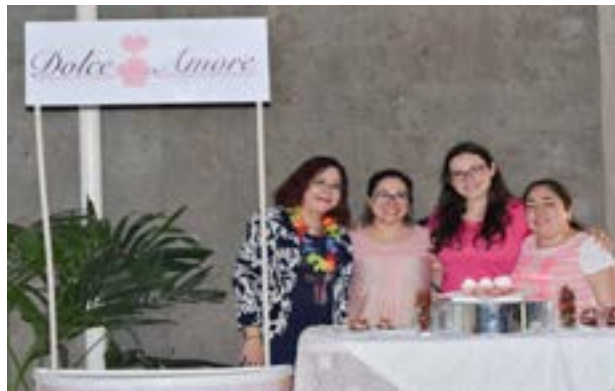
Grupo No. 2, producto: variedad de cupcakes