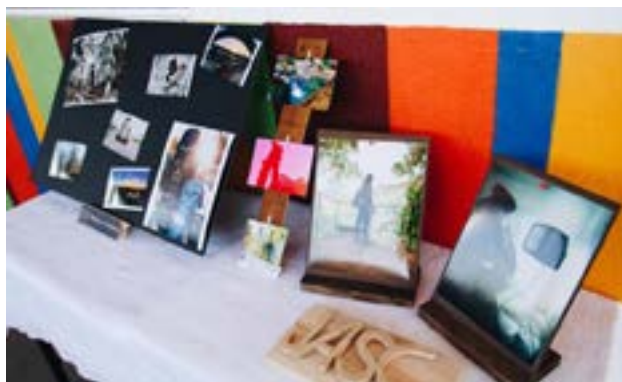
Trabajos de los estudiantes