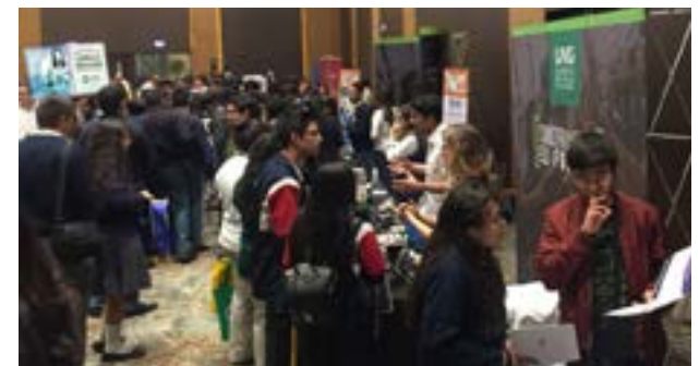
Plano general de los estudiantes de diversificado que asistieron a la actividad Aula 2018