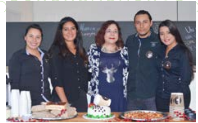
Grupo No. 3, producto: café y quesadilla