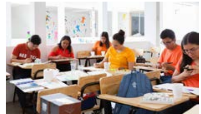
Participantes realizan los ejercicios en acuarela