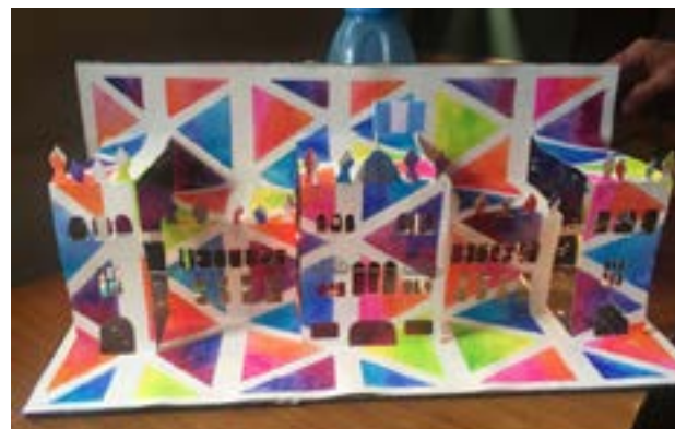
Detalle de la maqueta No. 5