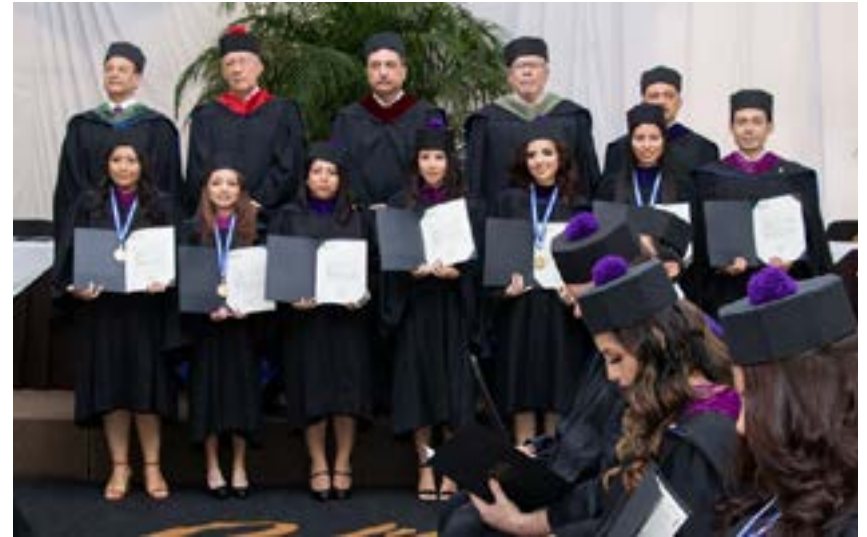
Grupo No. 3 de graduandos