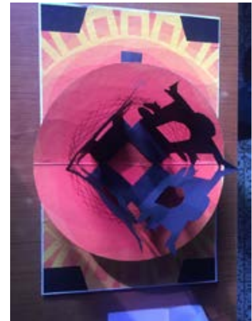
Fotografía maqueta tridimensional en colores fucsia y azul