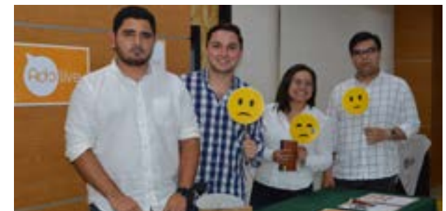
Grupo No. 4, empresa: Adc Live