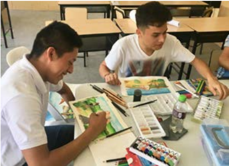
Foto No.5 Taller de Acuarela