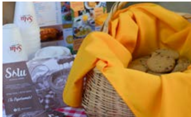
Los estudiantes dieron galletas y café a los visitantes de su stand