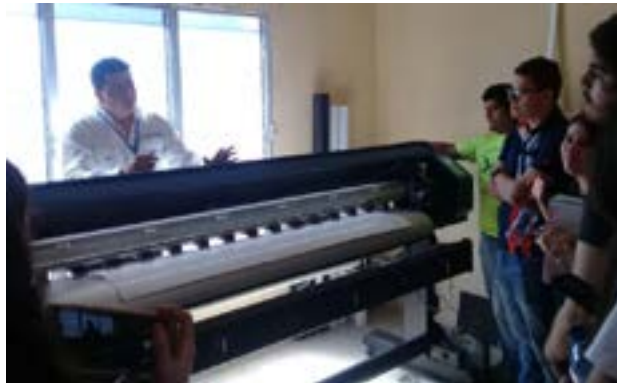
En la empresa Evolución Digital les explicaron la impresión en plotter