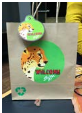
Detalle del empaque y marca del Grupo No. 2