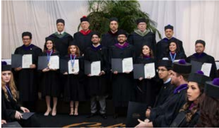
Grupo No. 1 de graduandos