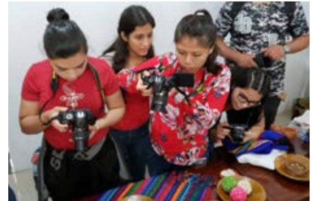
Estudiantes calibran la cámara fotográfica para realizar las fotos de comida