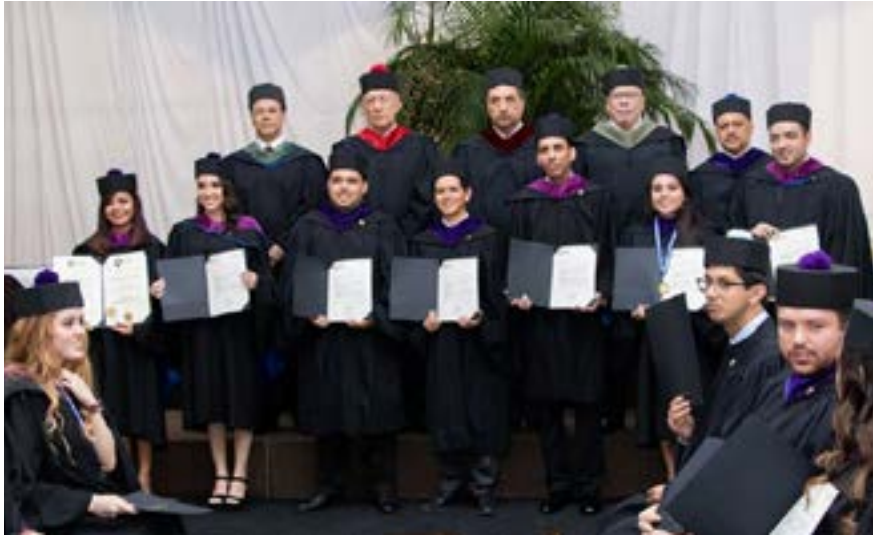
Grupo No. 7 de graduandos