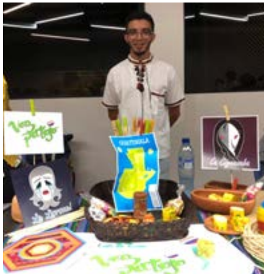
Grupo No. 1, marca publicitaria: Vos, patojo

Para poner en práctica varios conceptos como: marca, tipografía, psicología del color, empaque, entre otros, los estudiantes del primer año desarrollaron el proyecto: Welcom Gift.