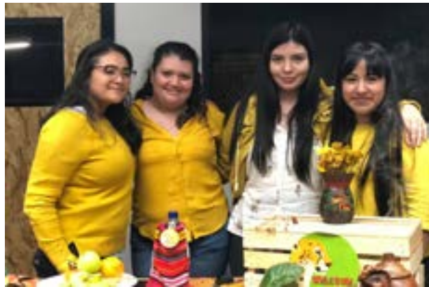
Grupo No. 2, marca publicitaria: Welcome