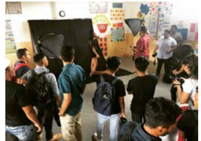
Colocación de fondo negro que sirvió para tomar fotos en el taller