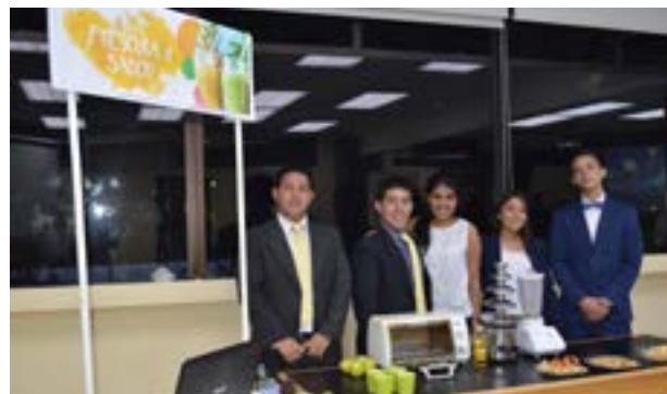
Grupo No. 3, producto: bebidas de frutas