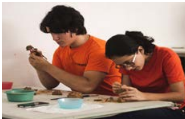
En proceso de elaboración de sus esculturas