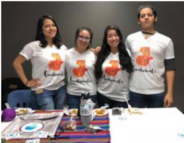
Grupo No. 5, marca publicitaria: Guatemala