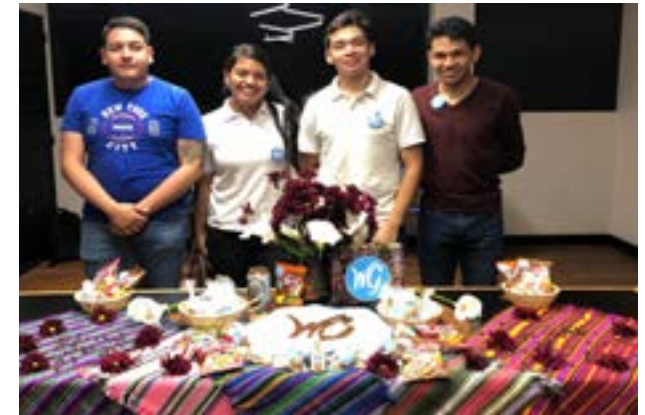
Grupo No. 3, marca publicitaria: WC