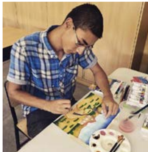
Foto No.3 Taller de Acuarela