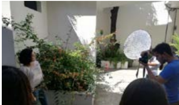
Moisés Ayala, Fotógrafo realizaron un taller de fotografía artística