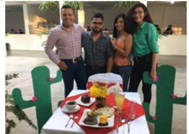
Grupo No. 3, Montaje: almuerzo vaquero a periodistas