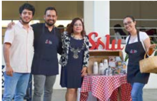
Grupo No. 6, proyecto realizado al restaurante Solu