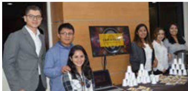
Grupo No. 3, empresa: Café Gitane