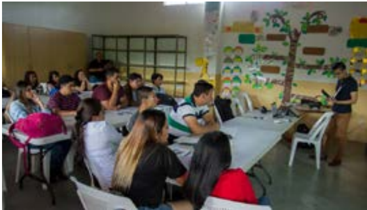
Foto No.1 participantes talleres en Jutiapa