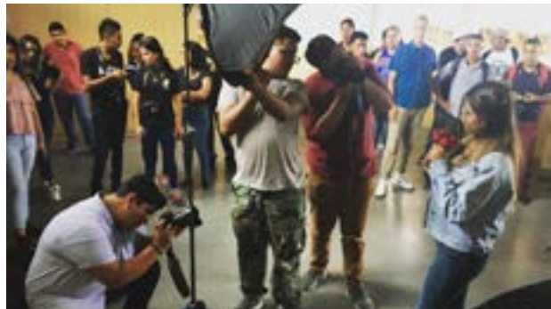
Estudiantes prueban el equipo de iluminación y sus cámaras fotográficas