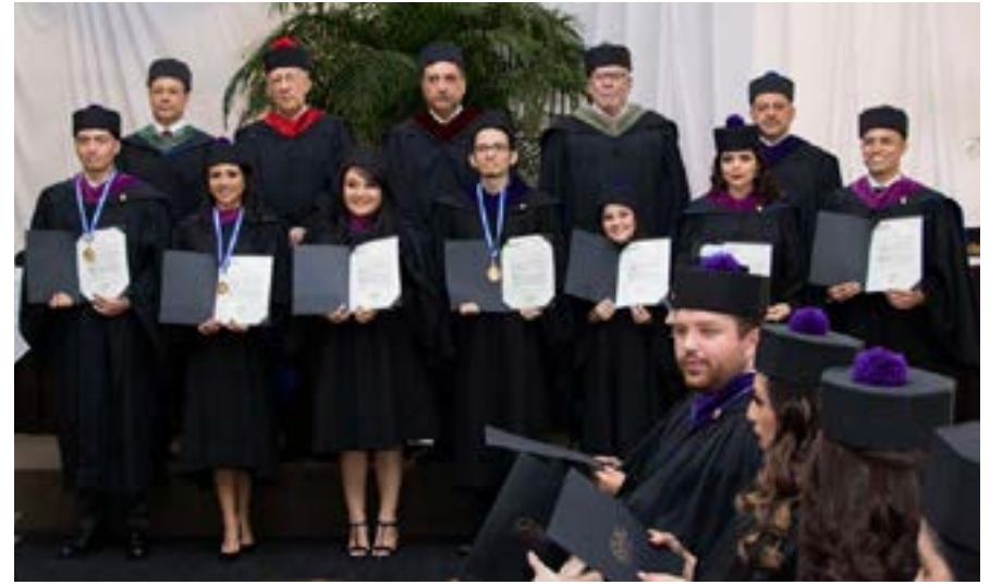
Grupo No. 6 de graduandos