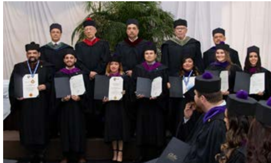
Grupo No. 8 de graduandos