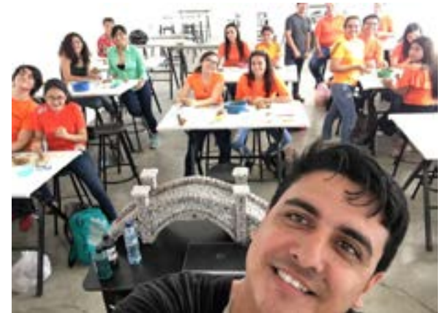
Fotografía de los participantes al taller de escultura