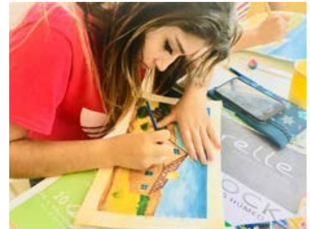
Foto No.3 Taller de Acuarela