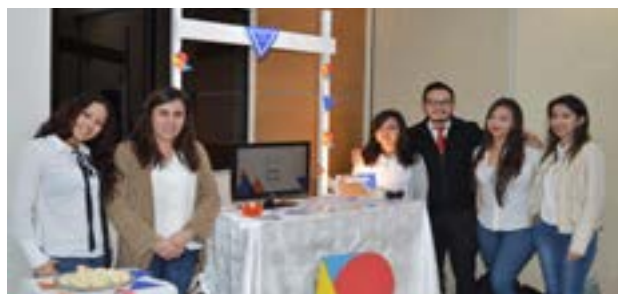
Grupo No. 2, empresa: Royale Studios