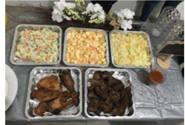
Comida: Carne, pollo, ensaladas rusa y arroz