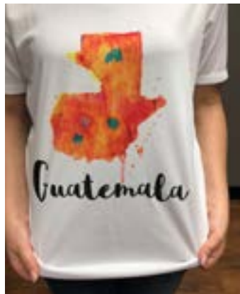
Playera del Grupo No. 5