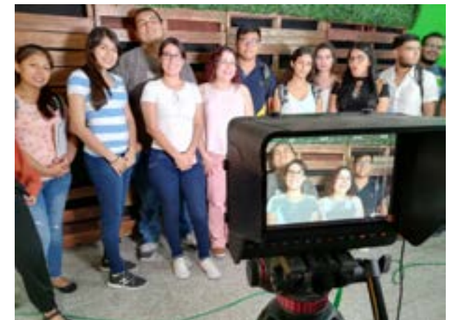
Fotografía en uno de los sets del canal de TV