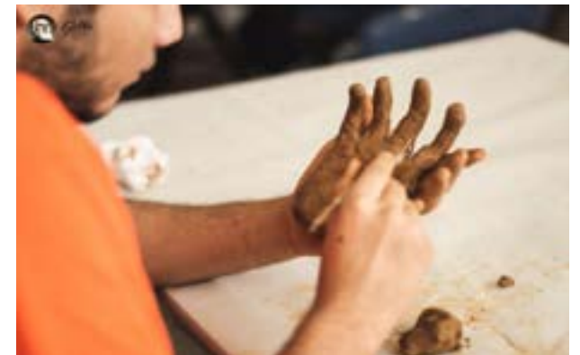
Detalle de una mano de barro