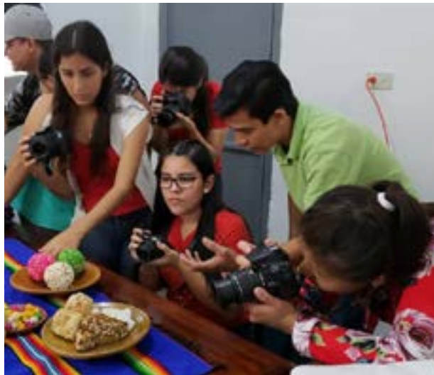
Grupo No.1: montaje de dulces típicos