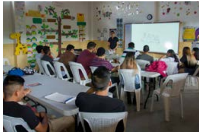
Foto No.2 Plano general de estudiantes de Jutiapa de 1er. y 3er. Año de la Licenciatura en Comunicación y Diseño