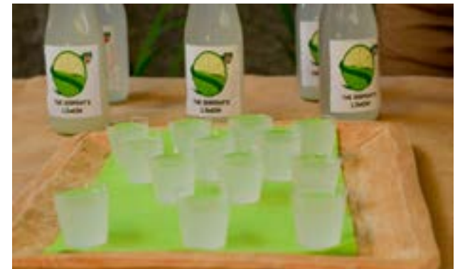
Detalle de la degustación de limonada