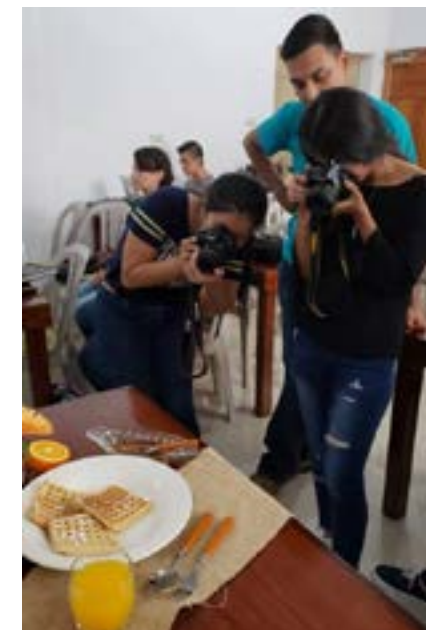
Grupo No. 4: montaje de desayuno