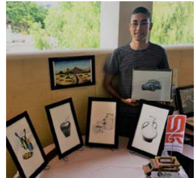
Estudiante de la sede de Jutiapa muestra sus trabajos