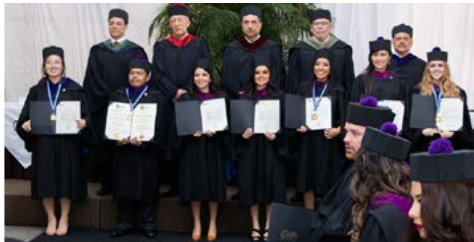
Grupo No. 5 de graduandos