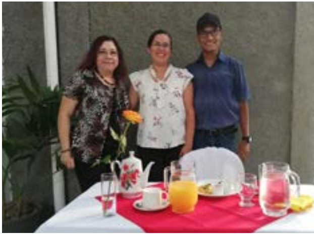
Grupo No. 4, Montaje: desayuno