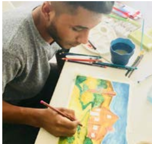
Foto No.2 Taller de Acuarela