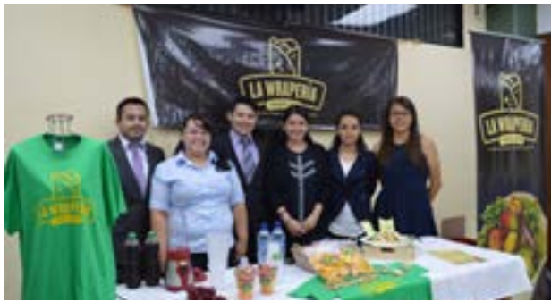
Grupo No. 1, empresa: La Wrapeña

En el curso de Gestión del Diseño, los estudiantes de tercero presentaron sus proyectos finales del lanzamiento de una empresa.