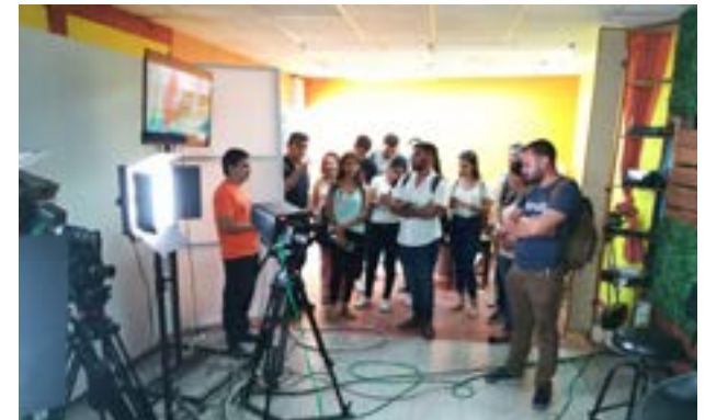
Los estudiantes visitaron los estudios del canal televisivo AMIGOS TV