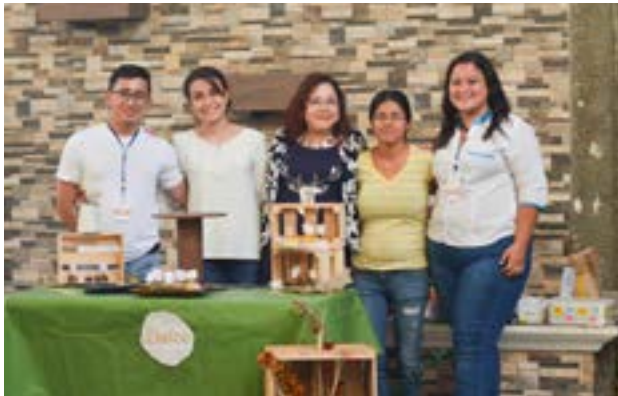
Grupo No. 5, producto: pastelería variada