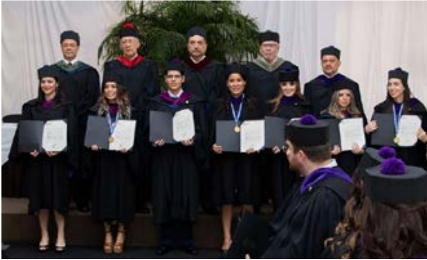
Grupo No. 4 de graduandos