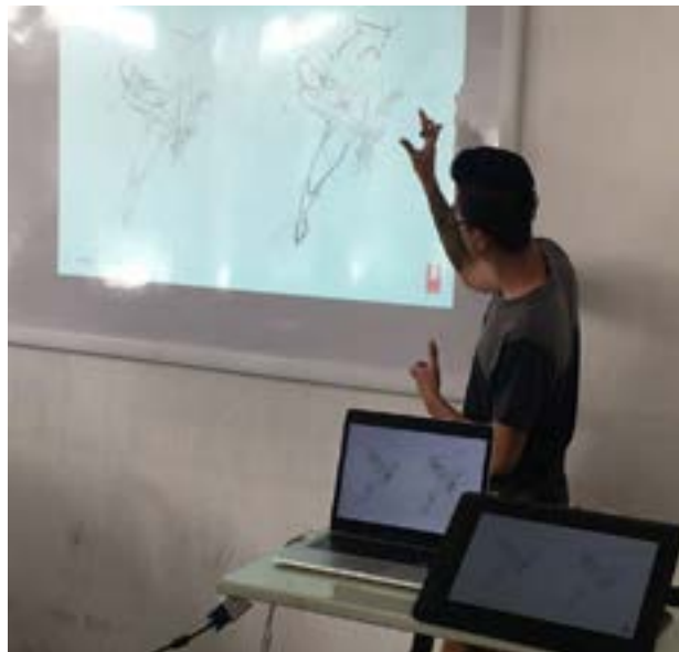
Jiménez explicó acerca de captar el movimiento en el dibujo de personas