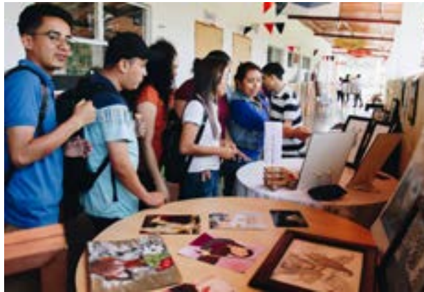
Los estudiantes visitan la exposición de fotografías y trabajos

También se llevó a cabo una exposición de fotos y trabajos de los estudiantes.