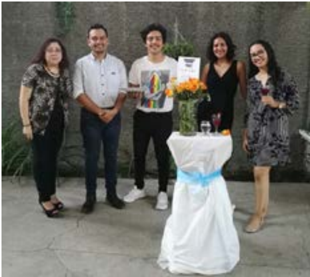
Grupo No. 1, Montaje de cocktail de noche

En el curso de Relaciones Públicas, los estudiantes de Quinto Año elaboraron montajes de eventos, con la finalidad de poner en práctica los conceptos de Etiqueta y Protocolo dados en el curso.