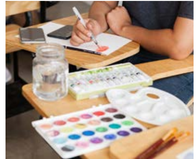
Detalle de materiales del taller de acuarela