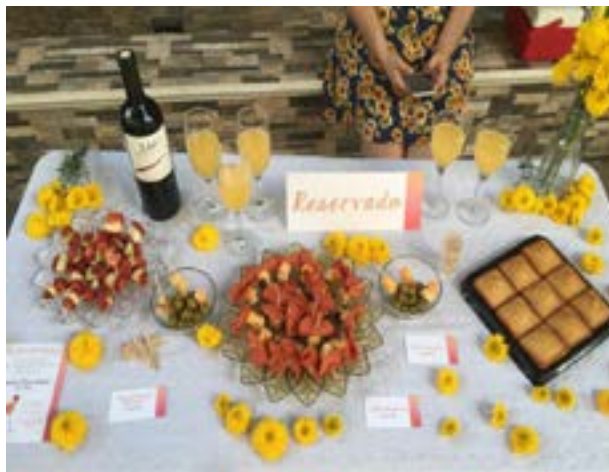
Variación de boquitas saladas y dulces