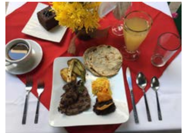
Comida: Carne asada, frijoles volteados, papa asada y tortillas