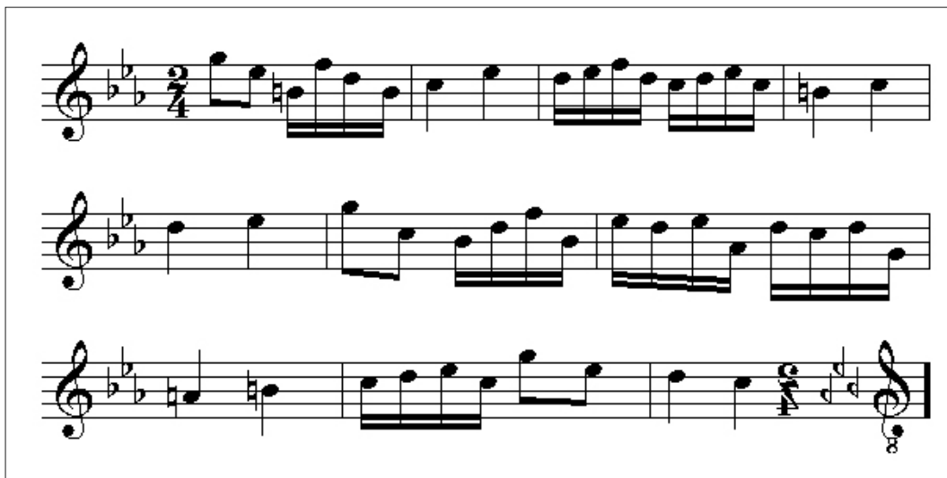
Cuadro 4. Canon IV por movimiento retrógrado

De un modo similar, Franz-Joseph Haydn (1732-1809), en el Minueto al rovescio (es decir, «al revés») de la Sonata para piano en do, escribe el segundo movimiento exactamente igual que el primero, pero al revés (véase el cuadro 4).